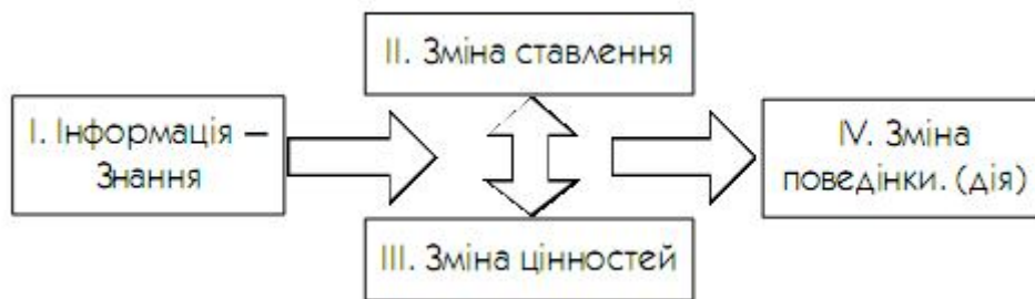
Рис. 1. Традиційна модель навчання

Кілька теоретичних зауваг. Традиційний підхід до освіти, що має на меті зміну суспільної поведінки, може бути представлений схемою.